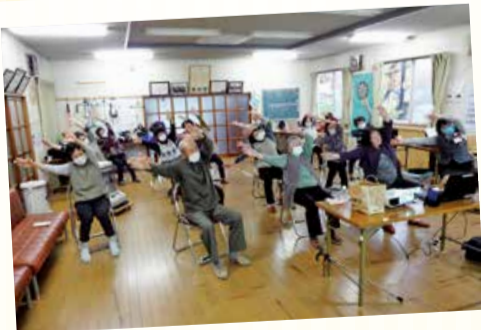
11/9 駅東班会 (駅東福祉会館)