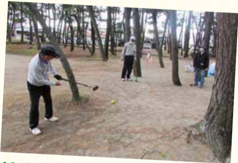
10/6 宮野浦支部GG大会 (九木原公園)

新型コロナウイルスが全国で拡大する中、友の会では 検温、手指消毒、換気などの感染予防対策を講じて、 ちいさな班会開催にとりくんできました。