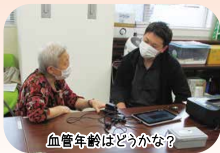
血管年齢はどうか？

友の会では、10月から11月にかけて、共同組織強化月間に取り組みました。コロナ禍で、会員の交流も少なくなってきた中、感染対策に つとめ、会員同士が繋がれる企画を行ってき ました。 4点の目標に対し、到達は次のようになって います。「仲間増やし87人」「班会開催88回」「班つ くり3班」「いつでも元気誌拡大7部」です。 班会は、フレイル予防を中心に行い、4つの支 部でグラウンドゴルフを開催しました。また、事 業所班での健康チェックは、7つの事業所で実 施し、新たなつながりができています。骨密度測 定ができる「会員限定無料健康チェック」は、普 段測定できない骨密度が測れ、喜んでもらいま した。 アウトリーチ活動では、健友会の職員が班会 や支部行事に参加して、医療・介護の困りごとを 聞き取るアンケートを行い、地域を知り、会員と 交流する機会になりました。本間病院まで個 別に送り迎えをする通 院支援サービスを開始 し、会員の通院を支え ています。 今後も、会員の皆さんと手をつなぎ、友の 会を大きくしていきたいま しょう。