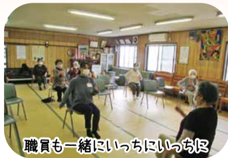
職員も一緒にいっしょにいっしょ