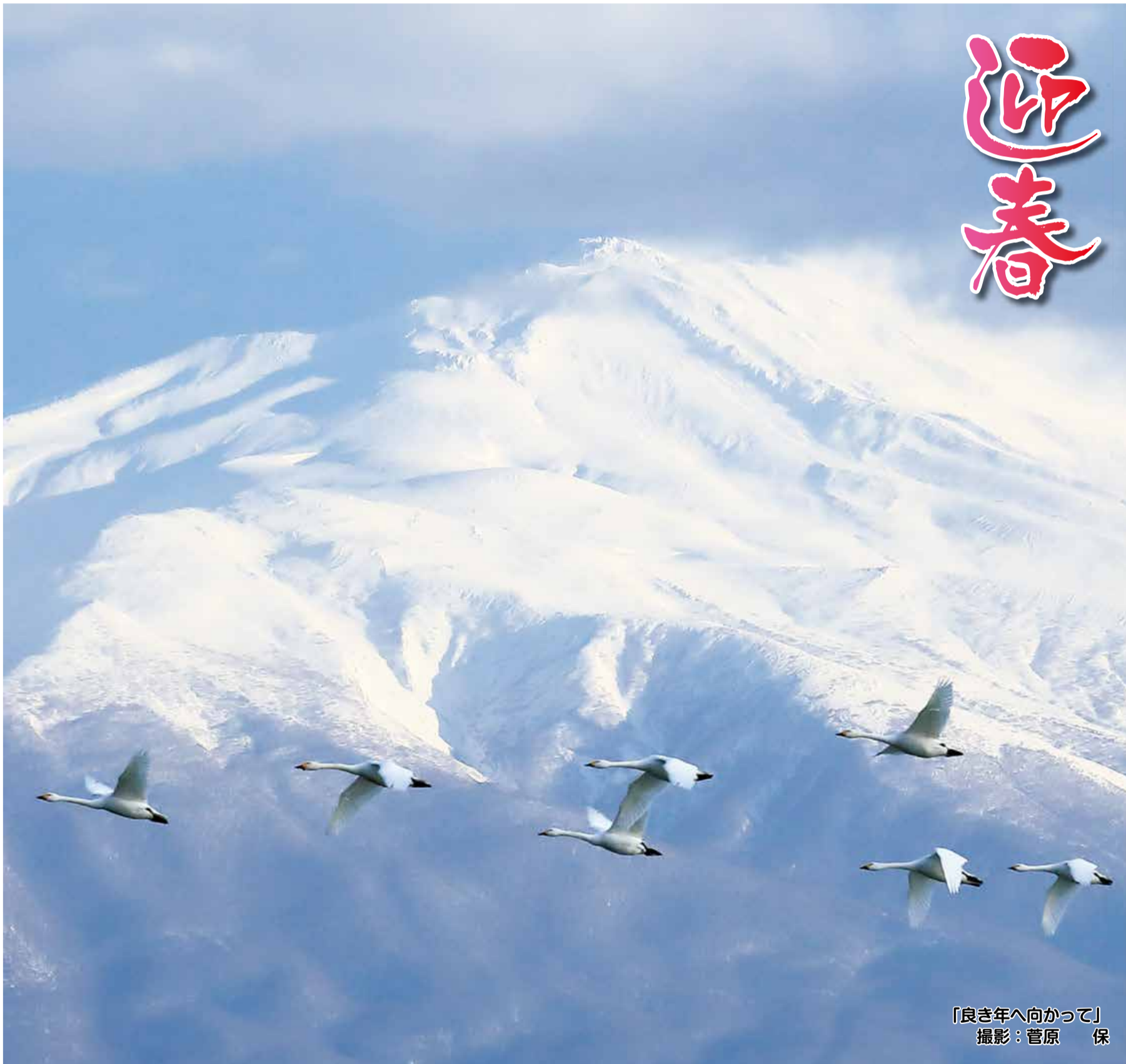
「良き年へ向かって」