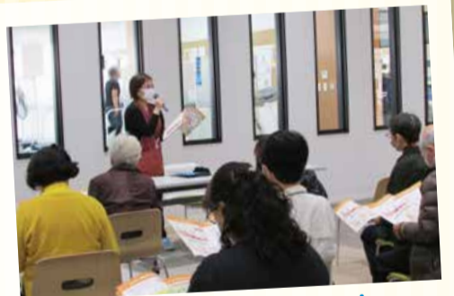
11/4 元気王国食学セミナー (中町にぎわい健康プラザ)