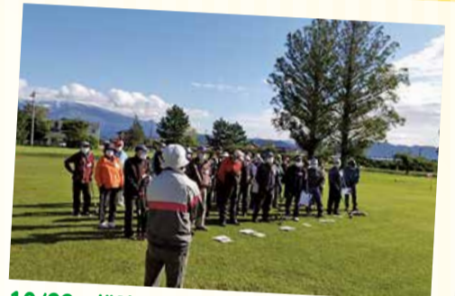
10/22 松陵支部たのしいグラウンドゴルフ (南遊佐グラウンドゴルフ場)