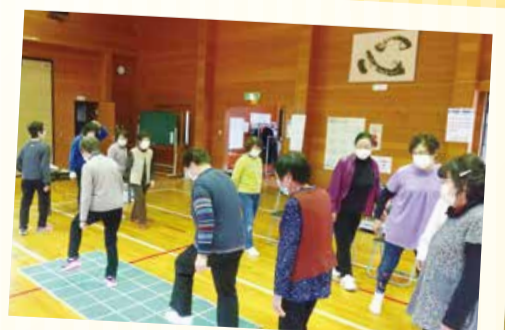
11/22 元気体操教室 (宮野浦コミセン)