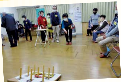
10/27 浜田支部 (駅東福祉会館)