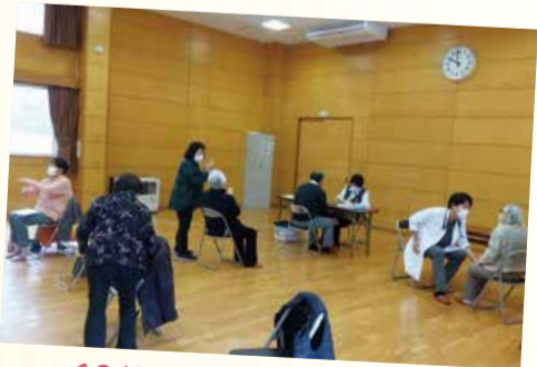
10/28 光ヶ丘1丁目班会 (松陵コミセン)