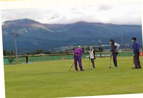
10/13 遊佐支部 (鳥海パノラマパーク)