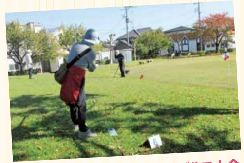
10/21 浜田支部グラウンドゴルフ大会

今年で10回目を迎えた大会。参加者29人で開催。秋晴れのもと、楽しく交流しました。