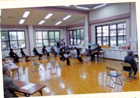
11/9 まちかど健康チェック(松原コミセン)

健康チェックと軽体操の班会。百歳体操とはまた違った体操で楽しかったと感想がだされました。