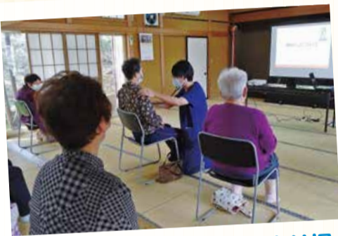
9/30 琢成支部 お気軽たまり場

日本海総合病院の阿部昂平先生による「肺がんについて」の講話を行ないました。参加者は9人で、先生に心音を確認してもらい、安心しました。