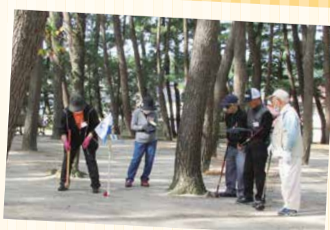
10/14 宮野浦支部グラウンドゴルフ大会

今年で10回目を迎えた大会。参加者29人で開催。秋晴れのもと、楽しく交流しました。