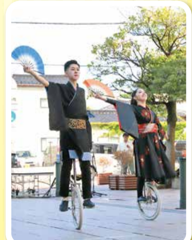
華やかな「ユニサイクルケセラ」の 演技にうっとり