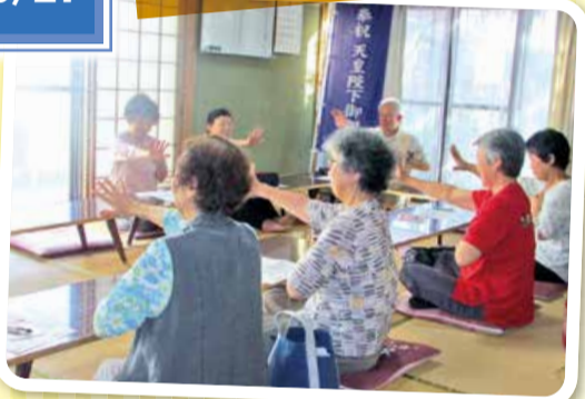
久々の班会で「認知症予防体操」をしました。