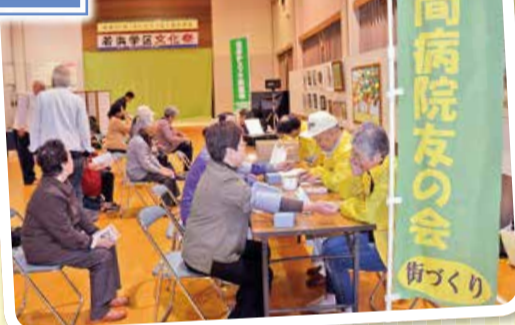
和気あいあいと健康チェックに46人参加。