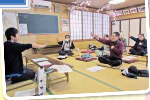
「頭と体の軽体操」のテーマで 作業療法士の講話と体操。