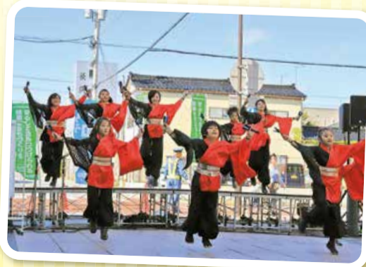
華麗なよさこいを披露「心華絆笑愛組」