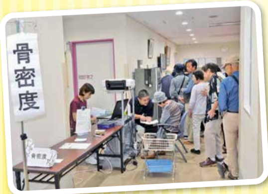
大盛況の無料健康チェック