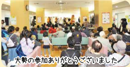
大勢の参加ありがとうございました