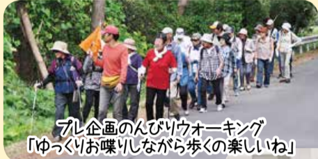
フレ企画のんびりウォーキング 「ゆっくりお喋りしながら歩くの楽しいね」