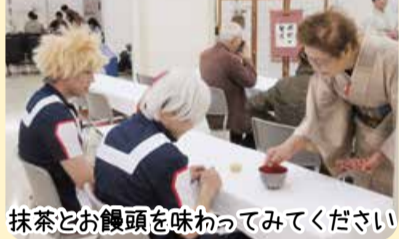
抹茶とお饅頭を味わっててください

秋の強化月間のキックオフ企画として、健康まつりが開催されました。今回は「楽しもう！地域の方々と一緒に！安心して健康なまちづくりを目指して」がスローガンです。前日からの台風の影響で、当日のぞみ診療所と本間病院内に、会場を変更しましたが、近隣の商店街でもイベントがあり、天候の影響は感じませんでした。 今回はフレ企画として9月21日に飯盛山公園から初孫酒造資料館まで歩くのんびりウォーキングを開催し、晴天のもと、参加者一同完歩しました。 健康まつりの中央舞台ではよさこい、カラオケ、太極拳、わなげ大会など観客と一体となって楽しみました。また、フリーマーケットは3店舗に増え、参加者の物欲を満たし、「これっ、幾ら」の声があちこちからあがっていました。大人気の健康チェックには長蛇の列で、健康への意識が垣間見えました。食べ物テント村は、芋煮、おそば、玉こんにゃく、おにぎりなど完売。病院内の抹茶写真サークルなどにも多くの人が訪れました。 来年こそは、秋晴れのもと、会員の皆さんで、笑顔で集まりましょう！お待ちしております。