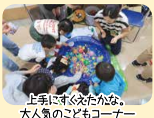
上手にすくえたかな。 大人気のごどもコーナー