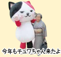
今年もチュウちゃん来たよ