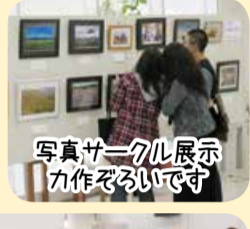
写真サークル展示 力作ぞろいです