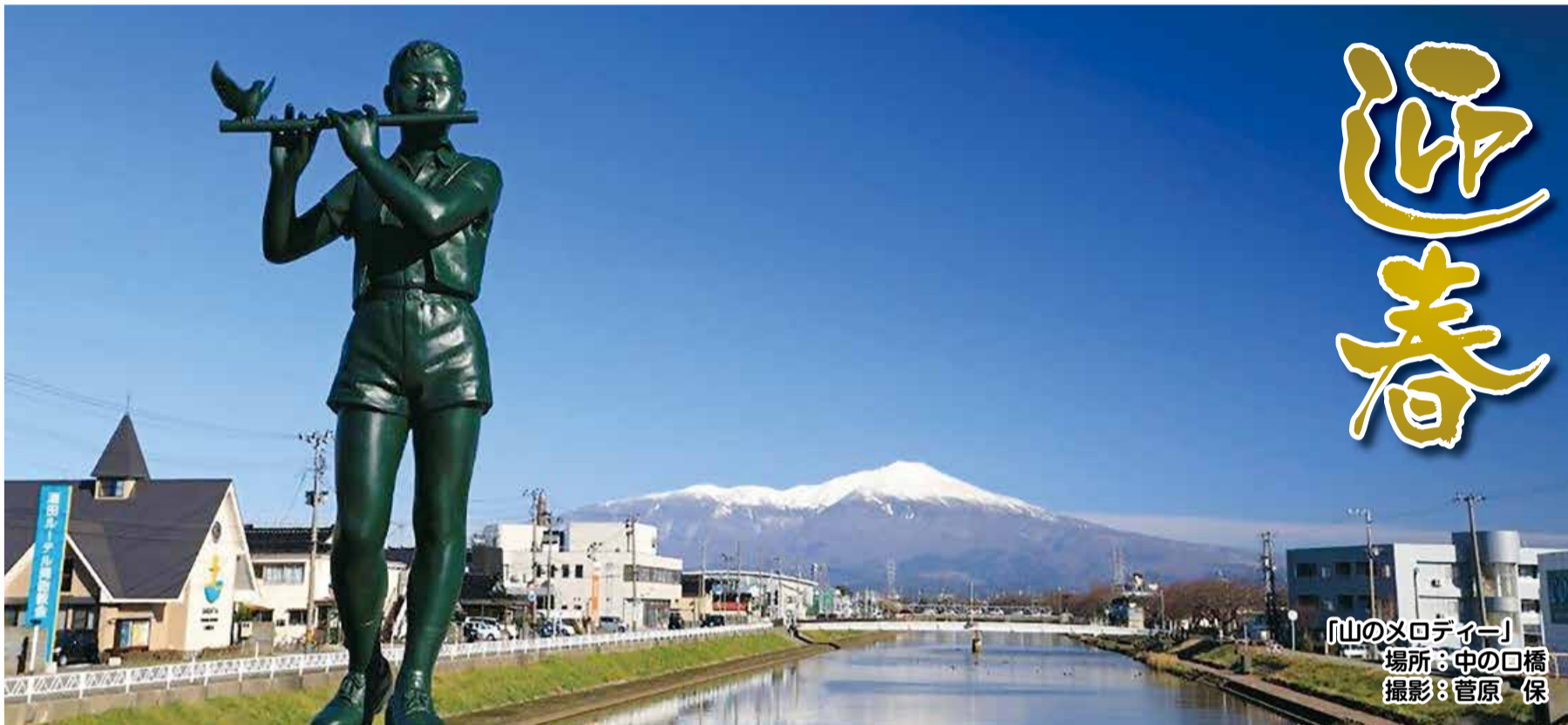
「山のメロディー」 場所：中の口橋