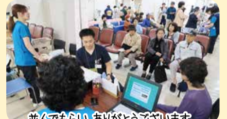
並んでもらいいありがとうございます。 名物企画健康チェック

秋の強化月間のキックオフ企画として、健康まつりが開催されました。今回は「楽しもう！地域の方々と一緒に！安心して健康なまちづくりを目指して」がスローガンです。前日からの台風の影響で、当日のぞみ診療所と本間病院内に、会場を変更しましたが、近隣の商店街でもイベントがあり、天候の影響は感じませんでした。 今回はフレ企画として9月21日に飯盛山公園から初孫酒造資料館まで歩くのんびりウォーキングを開催し、晴天のもと、参加者一同完歩しました。 健康まつりの中央舞台ではよさこい、カラオケ、太極拳、わなげ大会など観客と一体となって楽しみました。また、フリーマーケットは3店舗に増え、参加者の物欲を満たし、「これっ、幾ら」の声があちこちからあがっていました。大人気の健康チェックには長蛇の列で、健康への意識が垣間見えました。食べ物テント村は、芋煮、おそば、玉こんにゃく、おにぎりなど完売。病院内の抹茶写真サークルなどにも多くの人が訪れました。 来年こそは、秋晴れのもと、会員の皆さんで、笑顔で集まりましょう！お待ちしております。