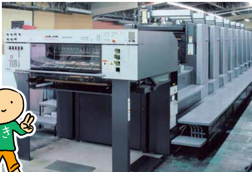
この機械で、会報印刷しています

友の会とは年5回の会報「健康のなかま」発行の構成打ち合わせから印刷まで関わり、社員の皆さんには本間病院健診センターで健診を受ける際に、オプション検査の割引料金の利用をいただいています。