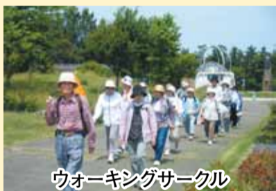
ウォーキングサークル