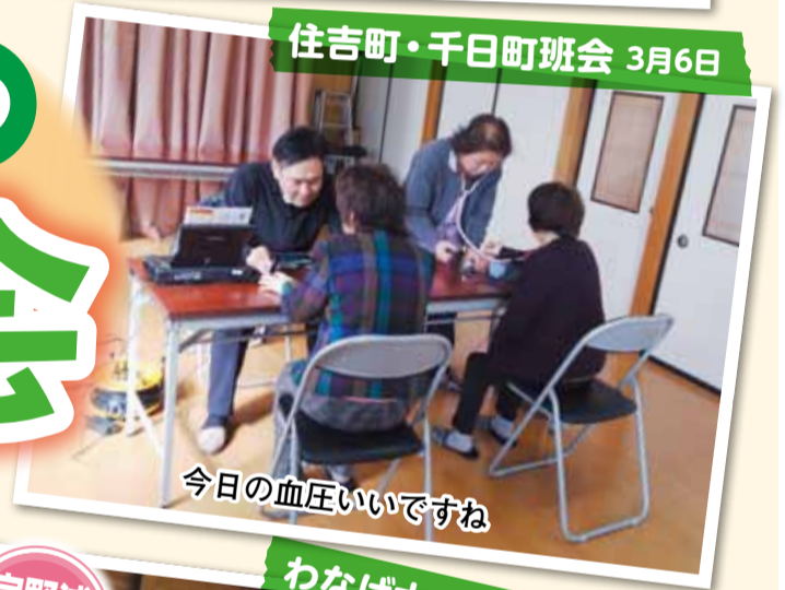
今日の血圧いいですね