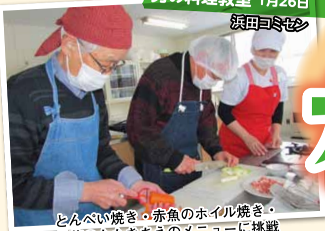
とんぺい焼き・赤魚のホイル焼き・ 長芋のたたきあえのメニューに挑戦