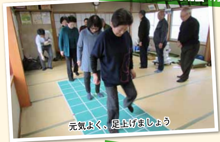
元気よく、足上げましょう