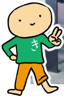
北星印刷公認キャラ「キタツチ」