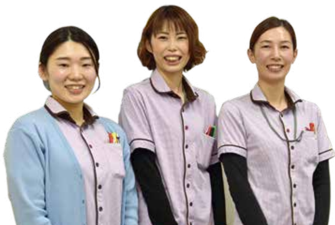
本間病院 健康支援科の皆さん